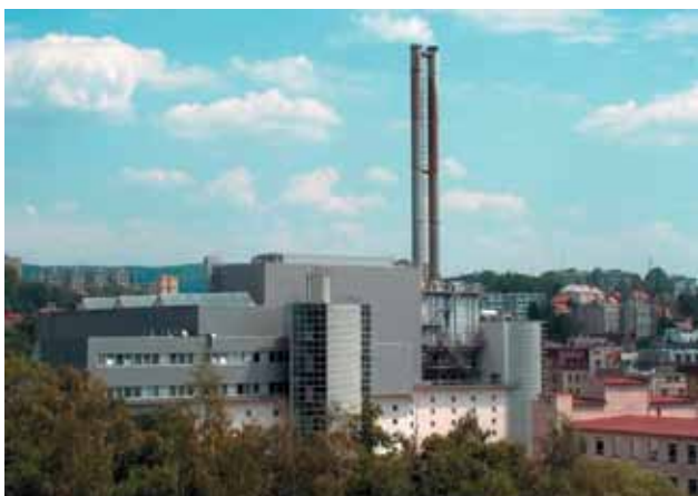
Spalovna, technologické zařízení sloužící ke spalování odpadu.

Je však taková situace opravdu obvyklá, a jsou tedy NNO vždy jen soupeřem veřejné správy?