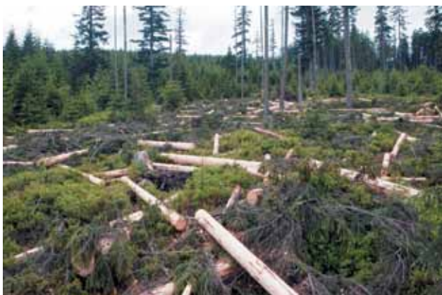
Největší ze čtyř národních parků České republiky, Národní park Šumava, je v poslední době častým tématem veřejných diskuzí. (Foto: D. Zývalová).

je jiná. Ve své činnosti se řídí zákony, které jim určují, případně svěřují pravomoci, v jejichž rámci spravují stát nebo samosprávnou jednotku. A protože se řada rozhodnutí orgánů veřejné správy dotýká povolování případně prosazování ekonomických aktivit (dopravních staveb, průmyslových zón, zařízení na likvidaci odpadů, obchodních center, ad.), jejichž výstavba a provoz mohou mít negativní dopad na životní prostředí, stává se často, že se při projednávání a rozhodování dostávají názorově na opačnou stranu bariéry, než veřejnost, často reprezentovaná či spolupracující s neziskovou organizací. Některé střety jsou natolik medializované, že vytvářejí klišé o protichůdných zájmech environmentálně orientovaných NNO, resp. veřejnosti a veřejné správy. Typickým a mediálně vděčným příkladem je problematika sporu o míru ochrany přírody v první zóně Šumavského národního parku, kterýkoliv záměr na výstavbu spalovny odpadů, výstavba dálnic (např. obchvat Plzně, dálnice D 8), apod.